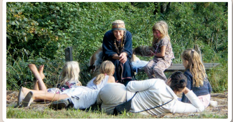
Geschichten und Geschichte für Gross und Klein

Das Alamannen-Museumsdorf Mäder ist der Geschichte und Kultur der Alamannen gewidmet, welche spätestens in der 2. Hälfte des 6. Jahrhunderts n. Zr. nach Vorarlberg eingewandert sind. Dadurch haben sie Sprache, Brauchtum, Mentalität und viele andere große und kleine Dinge, welche bis heute an diese Vergangenheit erinnern, geprägt.