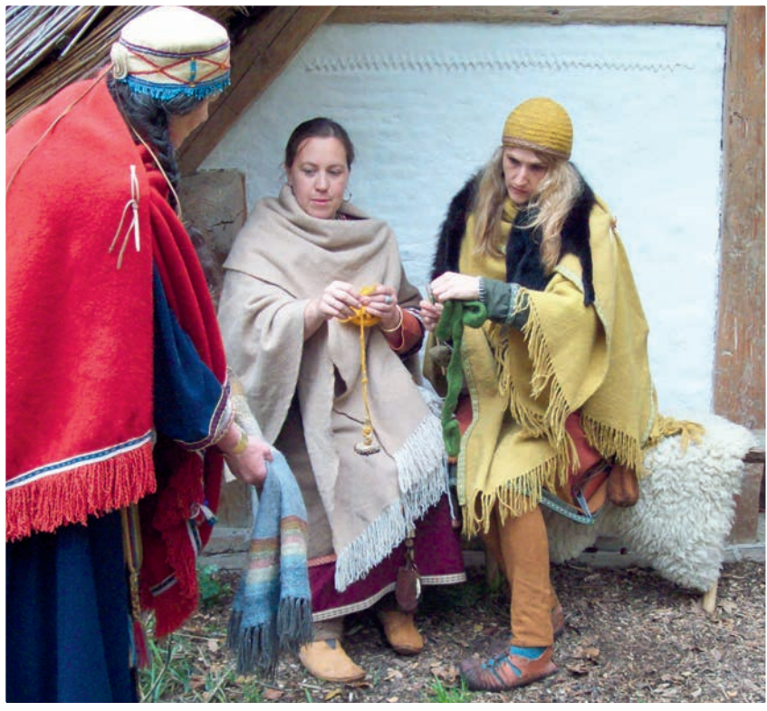
Altes Handwerk neu entdeckt